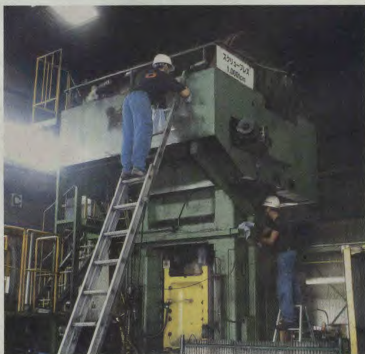
お盆休み前には社員がシャフト製造に用いるプレス機などを一斉掃除した